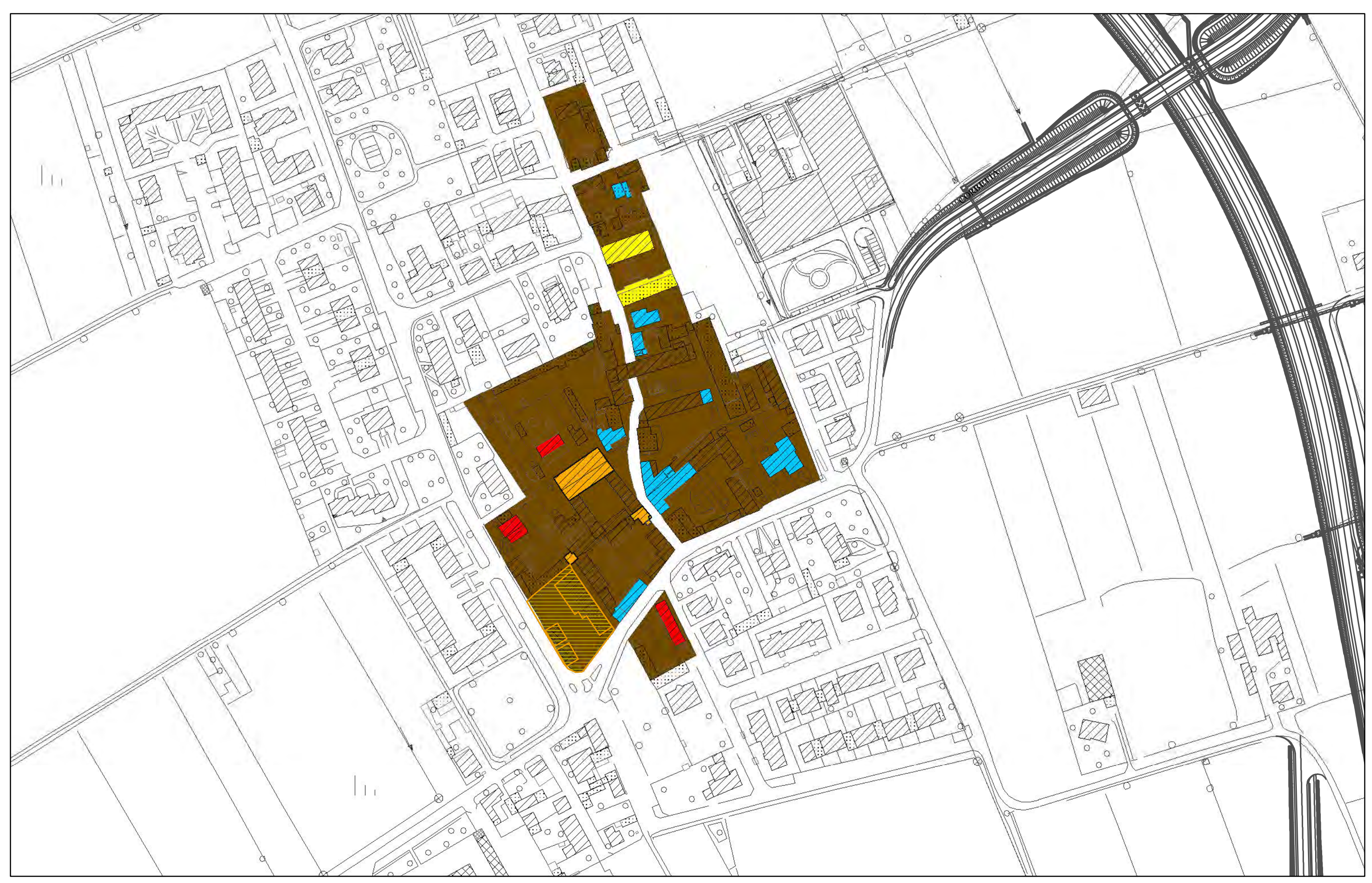
Castellazzo de' Barzi